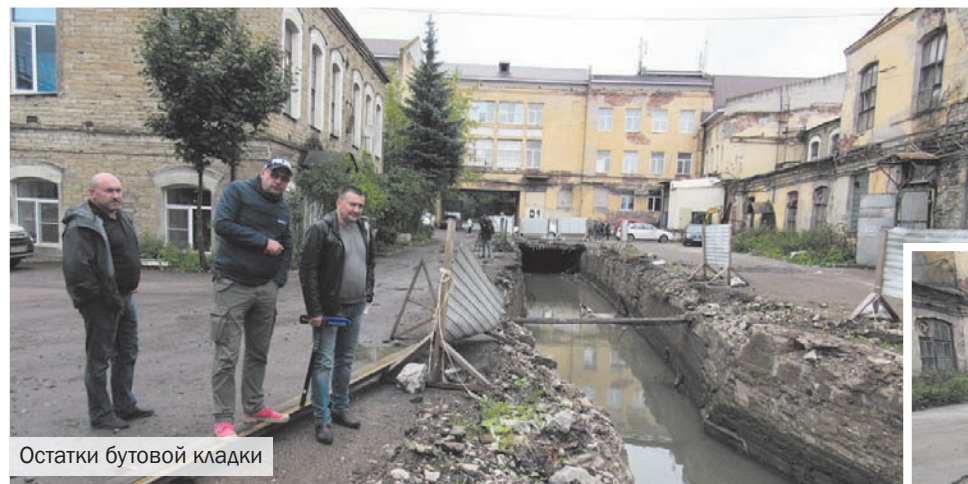
Остатки бутовой кладки

Корреспондент «Местной газеты» побывал на территории Красногородской бумажной фабрики, где сегодня полным ходом идёт капитальный ремонт местного гидротехнического сооружения.