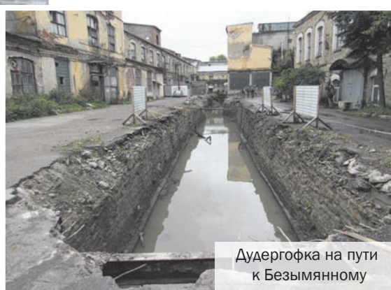
Дудергофка на пути к Безымянному

чему наше сооружение является историческим объектом, поэтому лерные и чугунные ограждения, а также мостки, придётся восстанавливать в подлинном виде. Для этого компания вышла на Ярославский литейный завод, который возьмётся за выполнение заказа.