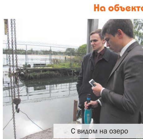
С видом на озеро