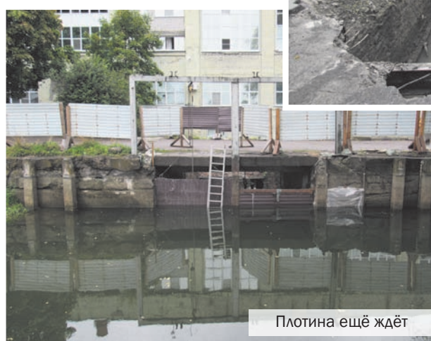
Плотина ещё ждёт

Планируется, что на объекте будет выполнено восстановление бетонных конструкций входного оголовка водосброса и двухступенчатого водобоя на участке длиной 22 метра, восстановление бетонных конструкций участка открытого канала протяженностью 28 метров, восстановление бетонных конструкций закрытого коллектора протяжен-